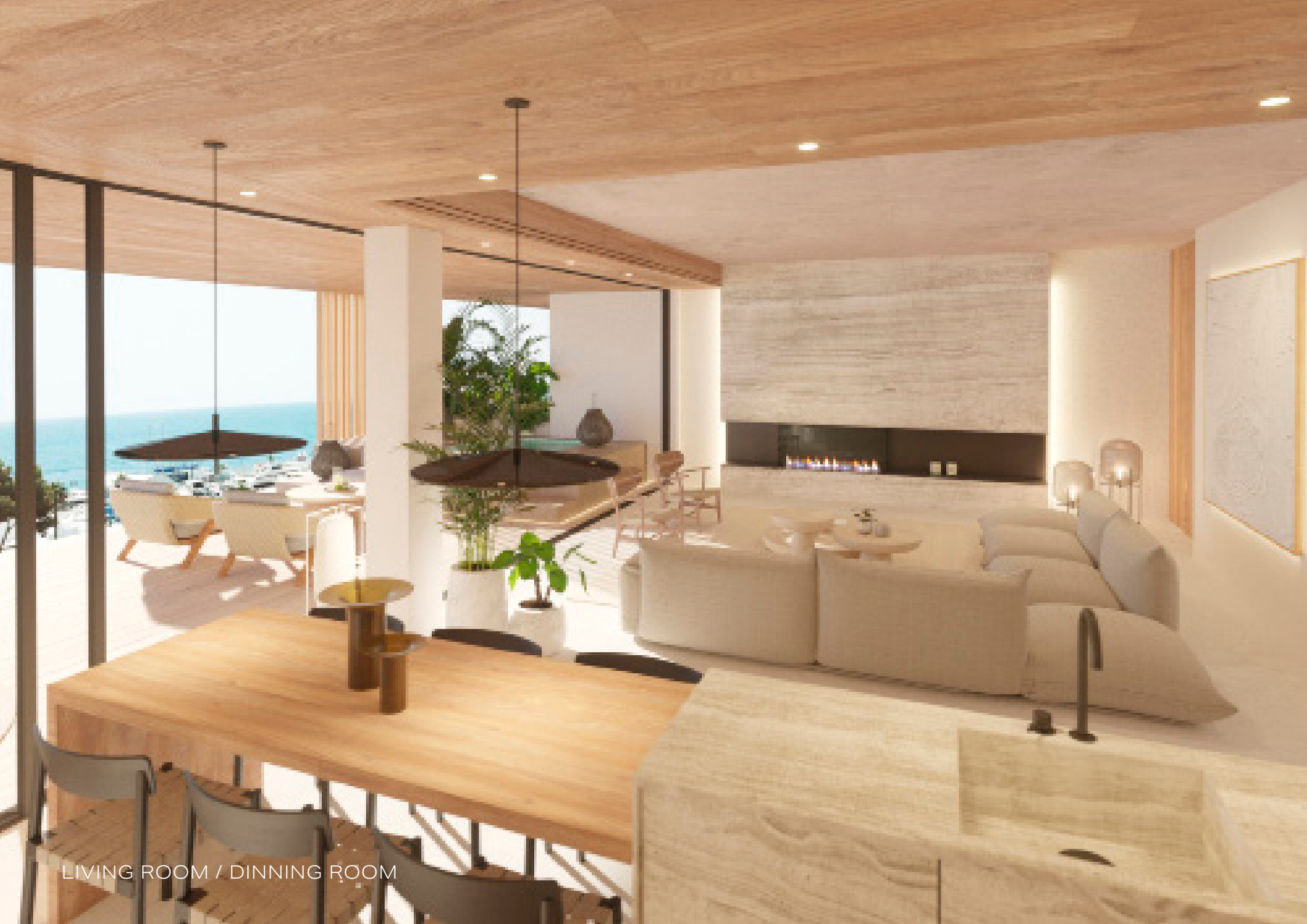
LIVING ROOM / DINNING ROOM