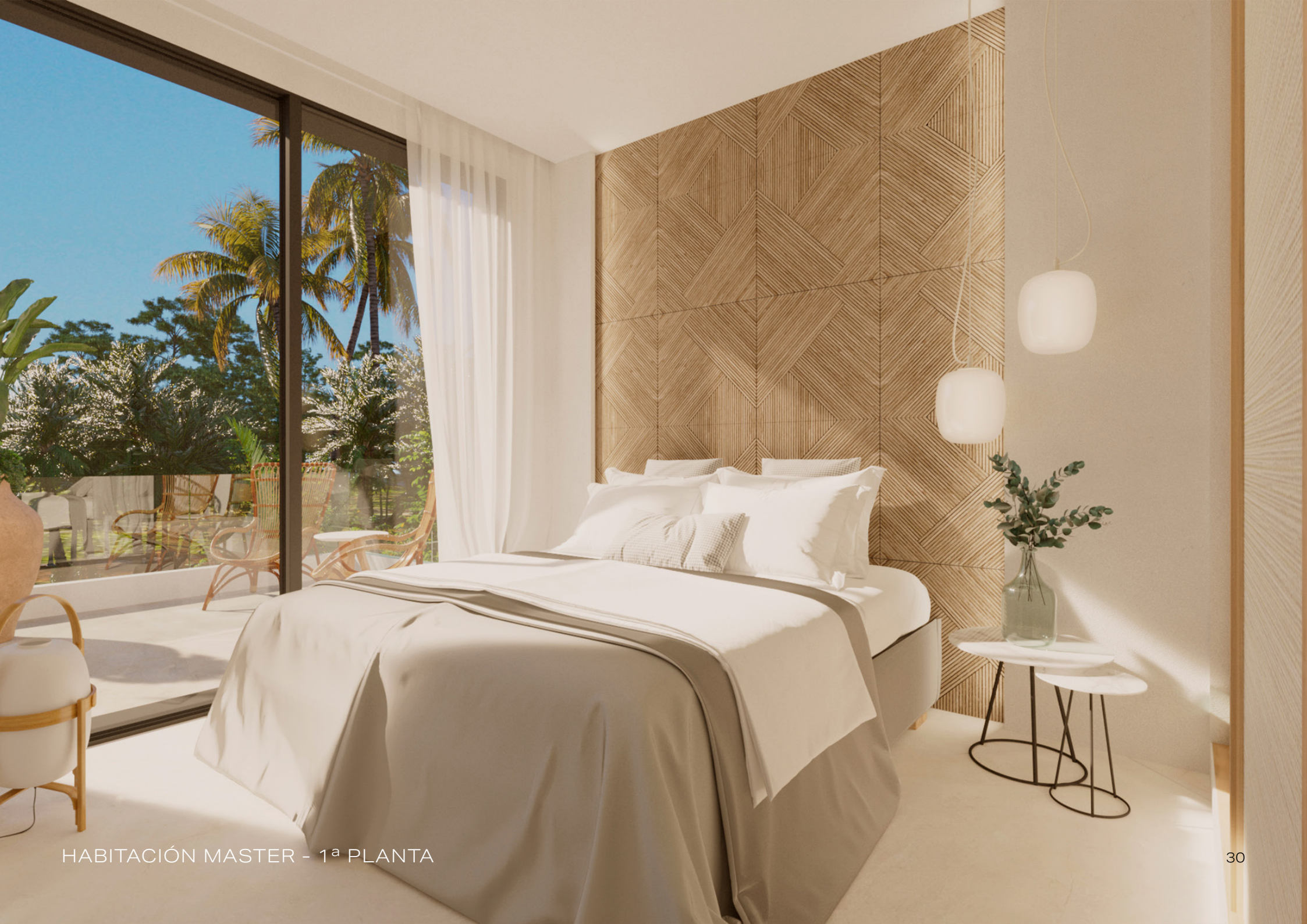
HABITACIÓN MASTER - 1ª PLANTA