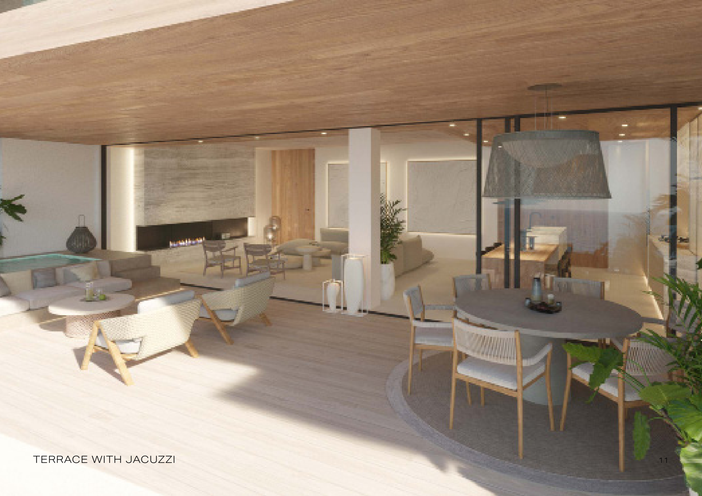
TERRACE WITH JACUZZI